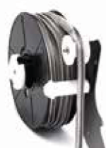
Clips en rouleau